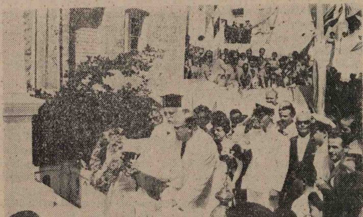
Ο Σύνδεσμος των Κιμωλιών τιμῆ τούς άθανάτους ήρωάς μας μετά την λιτάνευσιν των εικόνας την 15ην Αύγουστου

νύκτιον τò πλοίον παρέπλεε την Κίμωλον, οι εκδρομείς δέ είχαν συγκεντρωθῆ κοντά στις σκάλες αυτού άντιγκρίζοντες με όριγη ένθουσιασμού τὰ βουνά της πατρίδος μας που ξεχώριζαν βουβά μέσα στην άσέληνο νύκτα. Στο άντίκρουσμα του έπιβλητικού Ναού της 'Οδηγητριάς που ύψουτο άνάμεσα του ήλεκτροφώτιστου χωριού μας όλοι ήρχισαν νά σταυροκοπούνται που τούς ήξίωσεν ή Μεγαλόχαρη νά πατήσουν τὰ άγια χώματα της πατρίδος των. Με τò άγκυροβόλημα στο λιμανάκι της Ψάθης, ή όποία έλαμπε τόσον από τις φαιρινές γιολάντες όσον και από τις τεραστίες φωτιές που είχαν άνάψει οι κάτοικοι του νησιού στους κάβους της, ήρχισεν άμέσως ή αποβίβασις των εκδρομέων με παραδειγματικήν τάξιν έχοντες επί κεφαλής τò λάβαρον του Συνδέσμου, τò κουβούκλιον της Άγίας εικόνας του Σωματείου και τὰ μέλη του Δ. Συμβουλίου. Πλησιάζοντας τόν μώλον της Ψάθης, που ήτο θαυμάσια διακεκοσμημένος και ήλεκτροφωτισμένος δέν έβλεπε κανείς τίποτε άλλο, παρά ένα κινητόν σύννεφον