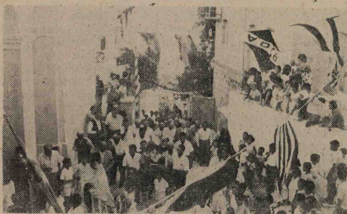
Ένώ ή πομπή της μεταφοράς της εικόνας του Συνδέσμου εύρίσκειται πρό του Ι. Ν. της ΟΔΗΓΗΤΡΙΑΣ μας

ΑΠΟ ΤΗΝ ΕΚΔΡΟΜΗΝ ΤΟΥ ΣΥΝΔΕΣΜΟΥ ΕΙΣ ΚΙΜΩΛΟΝ